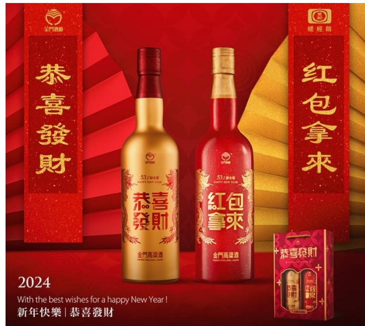
緞金龍(新春特仕版)